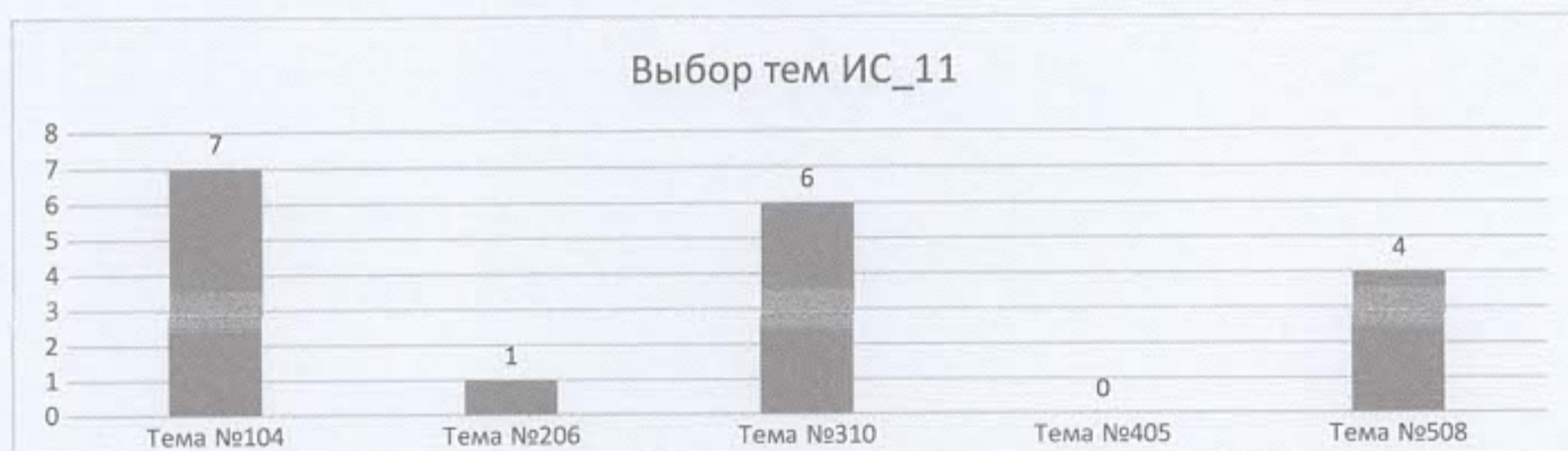
Диаграмма 2. Выбор тем итогового сочинения выпускниками 11-а класса

Из диаграммы 2 видно, что 7 обучающихся выбрали тему №104. Самая непопулярная тема – №405, ее не выбрал никто. Тему №206 выбрал 1 человек.